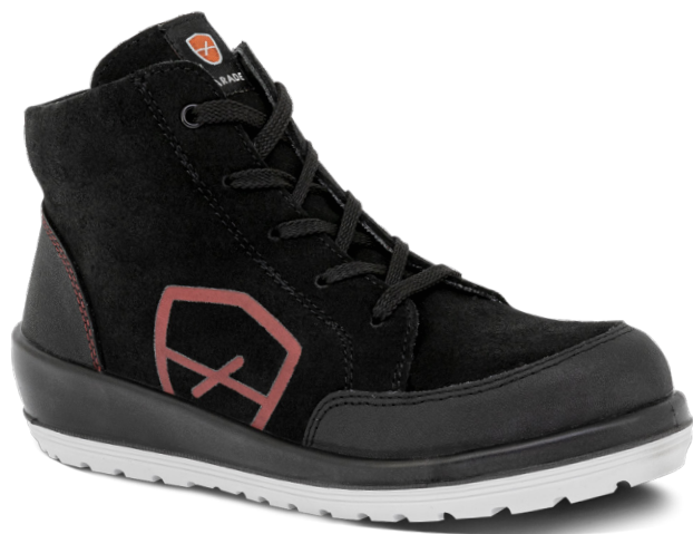
5716 NOIR ET ROSE | 35 ▶ 42