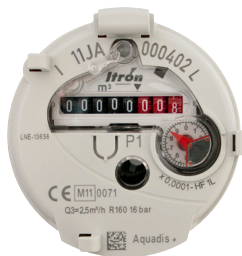
Totalisateur Version Eau Froide