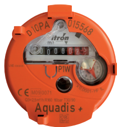
Totalisateur Version Eau Chaude