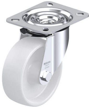
Roulette pivotante correspondante LE-PO 100G