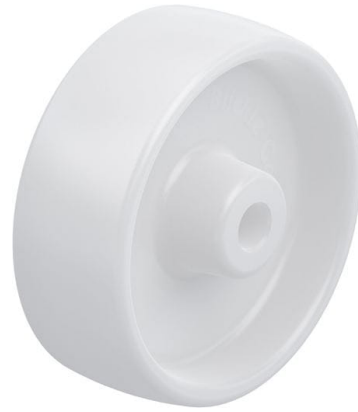
Roue utilisée PO 100/12G