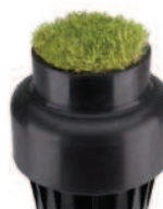
Kit de panier gazon P/N 467955