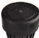
Kits de couvercles en caoutchouc I90-ADV : P/N 234200 I90-36V : P/N 234201