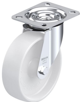
Roulette pivotante correspondante LE-PO 125G