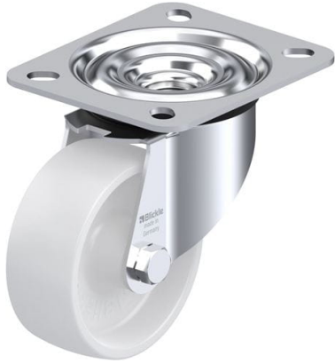
Roulette pivotante correspondante LE-PO 80G