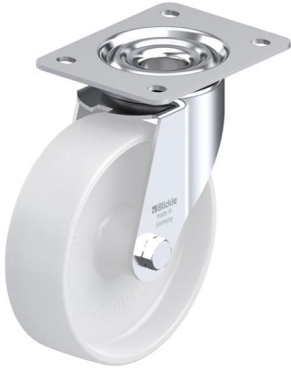
Roulette pivotante correspondante LE-PO 160G