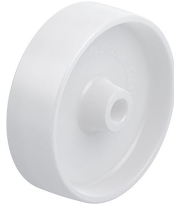
Roue utilisée PO 160/20G