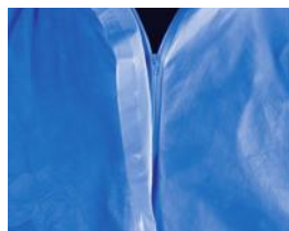
Fermeture à glissière frontale double curseur