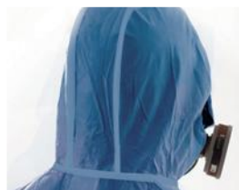
Capuche trois pans élastiquée