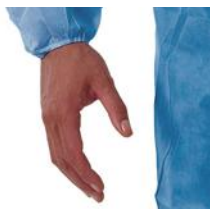
Taille, poignets et chevilles élastiqués