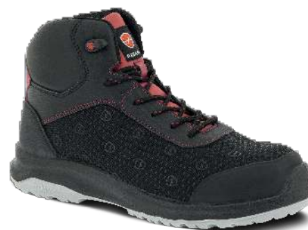
8836 ROUGE | 35 ▶ 48