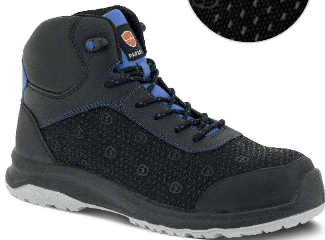
8832 BLEU | 35 ▶ 48