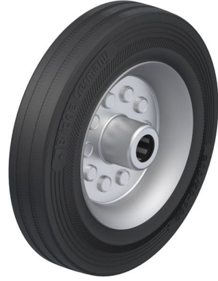
Roue utilisée VE 200/20R