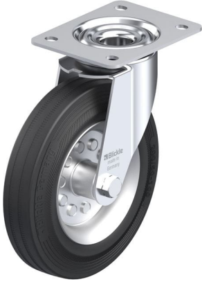
Roulette pivotante correspondante LE-VE 200R