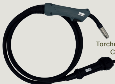
Torche MIG AIR 15 de 3 m Code 71 246 140