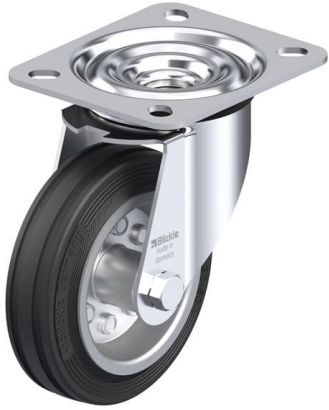
Roulette pivotante correspondante LE-VE 100R