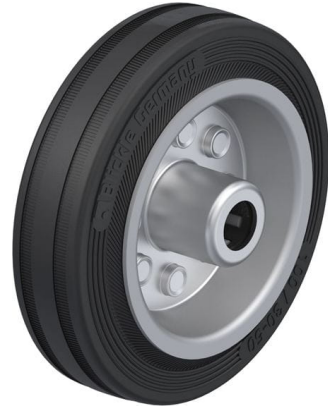
Roue utilisée VE 100/12R