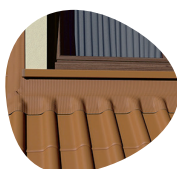
ÉTANCHÉITÉ DES MENUISERIES ET CHIENS-ASSIS