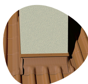
ÉTANCHÉITÉ DES CHEMINÉES