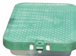
Couvercle Pehd Marquage Service des Eaux avec isolant.