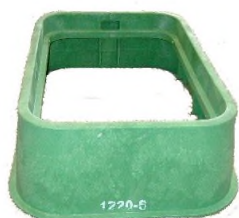
Rehausse (Hauteur 150 mm)