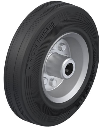
Roue utilisée VE 125/12R