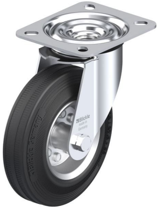
Roulette pivotante correspondante LE-VE 125R