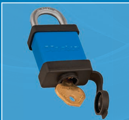
Facilite l'insertion des clés