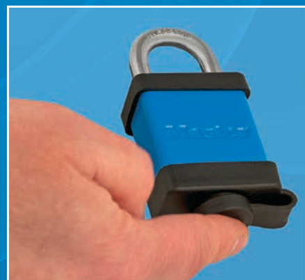
Une fois le cache serrure enclenché, le cylindre est protégé des impuretés