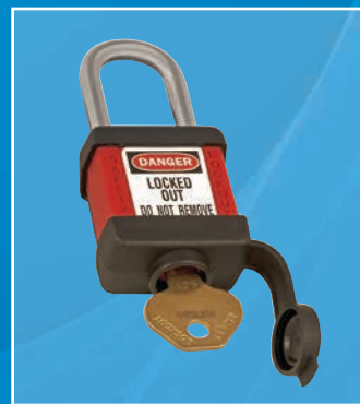
410REDCOV avec clé

L'option "COV" est disponible sur tous les cadenas de consignation MASTER LOCK ou AMERICAN LOCK. Pour passer commande, rien de plus simple : Il suffit d'ajouter le suffixe « COV » à la référence du cadenas - Ex : 410REDCOV