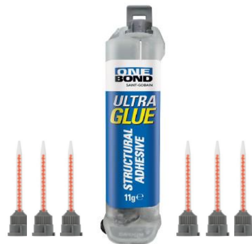
Seringue 11g + 6 mixeurs Sous blister