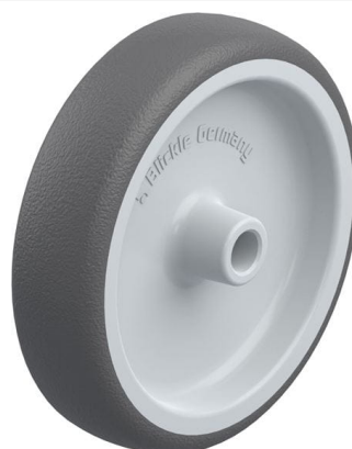
Roue utilisée PATH 125/12G