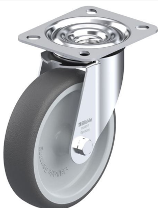
Roulette pivotante correspondante LE-PATH 125G