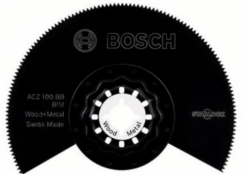
Image du produit, non emballé