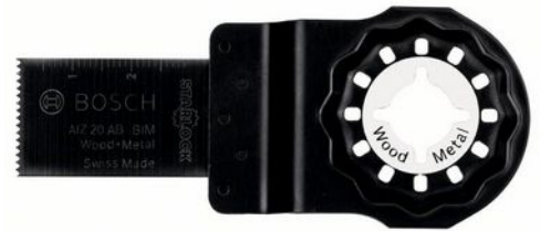
Image du produit, non emballé