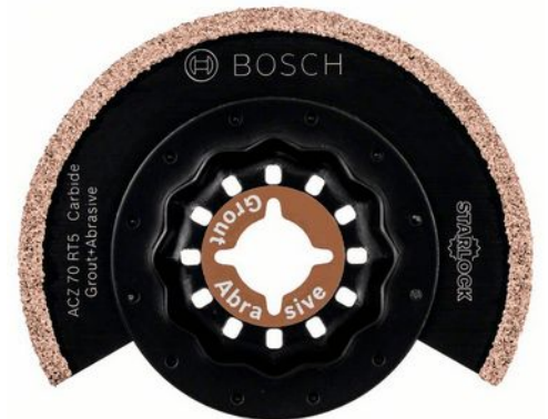
Image du produit, non emballé