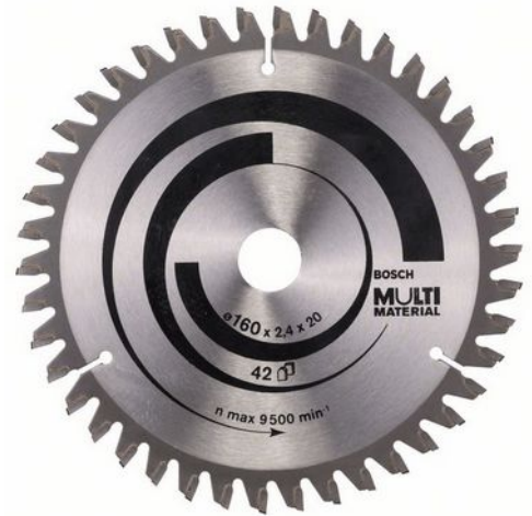
Image du produit, non emballé