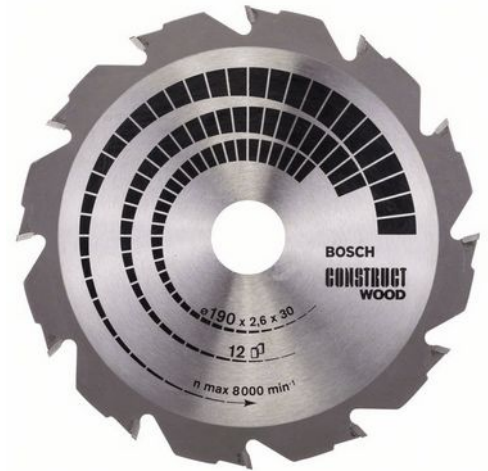
Image du produit, non emballé