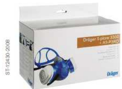
Dräger X-plore® 3300 avec filtres à baïonnette Dräger.