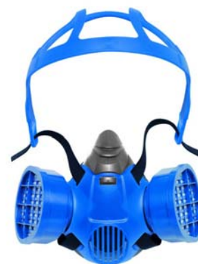
Demi-masque X-plore 3300

Certaines activités requièrent également une protection corporelle et cutanée (gants, vêtements de protection, lunettes, ...) Contactez-nous pour des ensembles de protection complets.