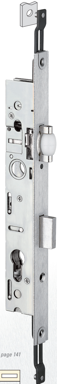
Plan page 141