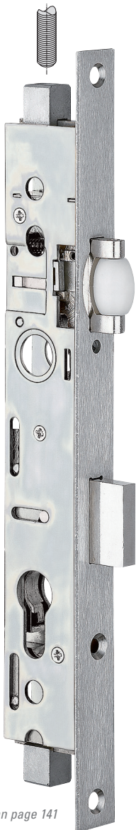
Plan page 141