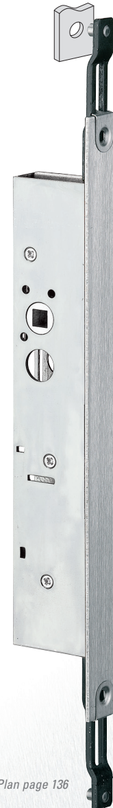
Plan page 136