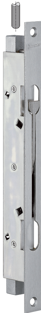
Plan page 136