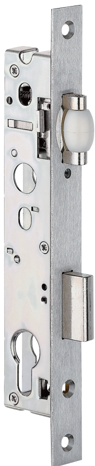
Plan page 138