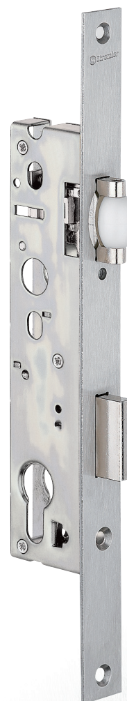
Plan page 138