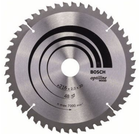
Image du produit, non emballé