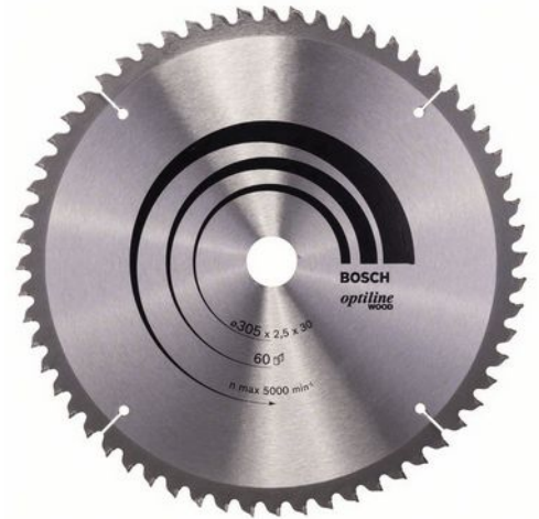
Image du produit, non emballé