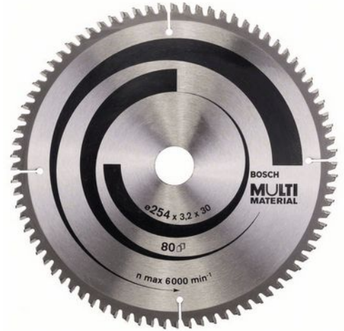
Image du produit, non emballé