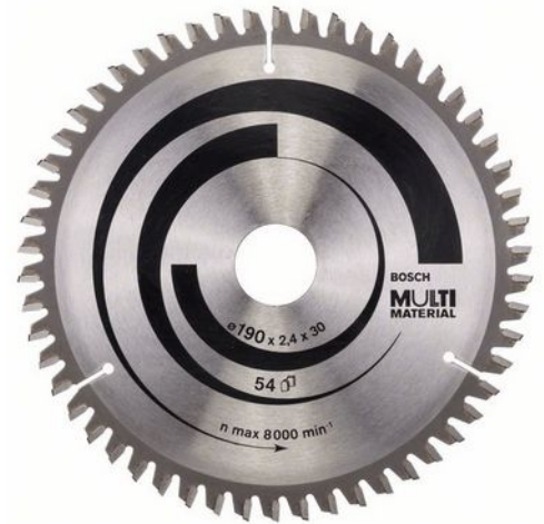
Image du produit, non emballé