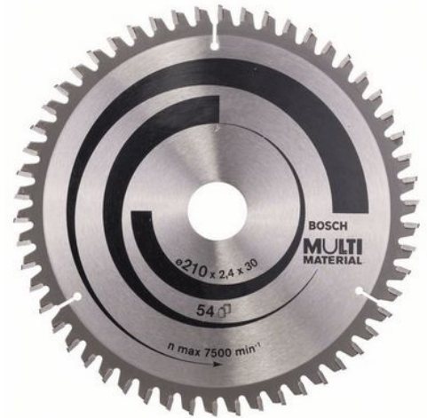
Image du produit, non emballé