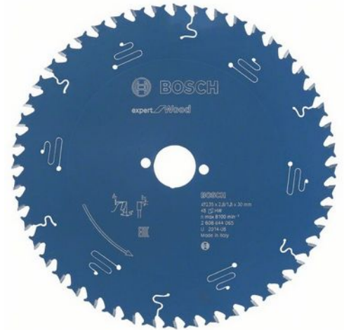
Image du produit, non emballé