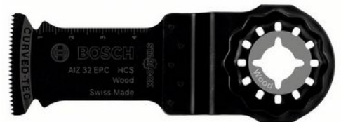
Image du produit, non emballé