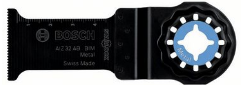
Image du produit, non emballé