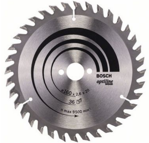
Image du produit, non emballé