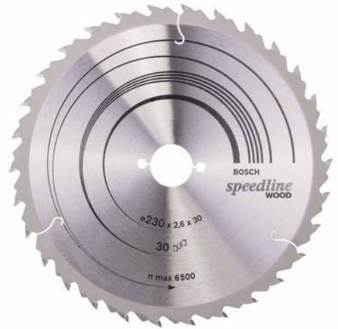
Image du produit, non emballé