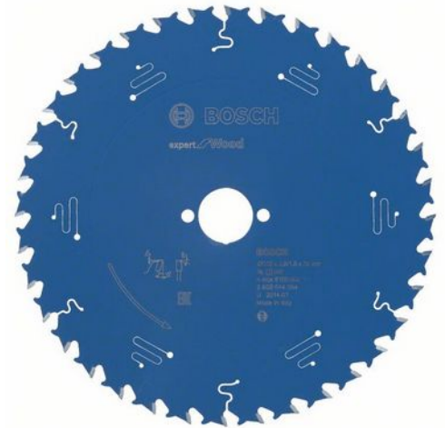
Image du produit, non emballé