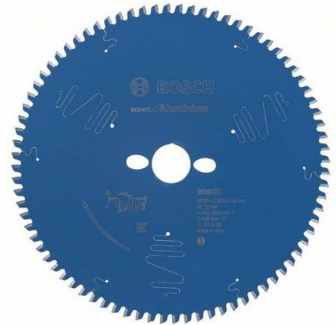
Image du produit, non emballé