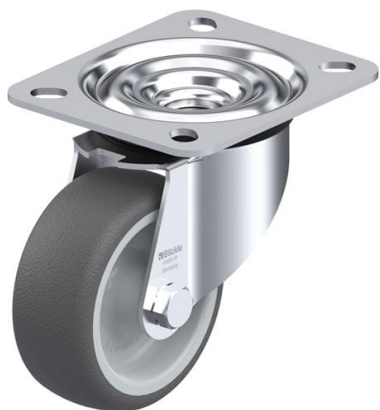
Roulette pivotante correspondante LE-PATH 80G