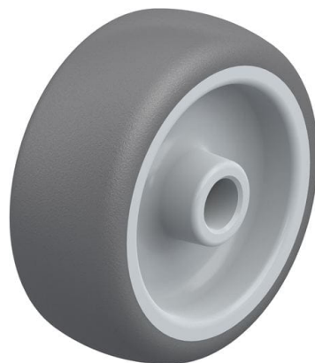
Roue utilisée PATH 80/12G