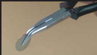
Pince à becs demi-rond coudés avec coupe-fil Angled half-round nose pliers with side cutter