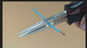
Pince à becs demi-rond droits - zone de coupe Half-round nose pliers with side cutter