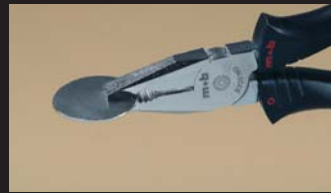
Pince universelle - zone de pincement Tightening Zone