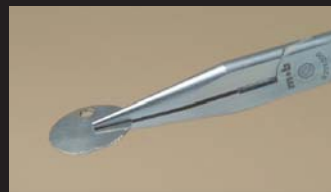
Pince à becs demi-rond droits Half-round nose pliers