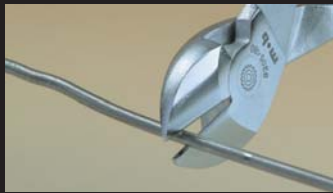
Pince coupante diagonale Diagonal cutting nippers