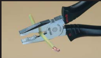
Pince universelle - zone de coupe Cutting zone