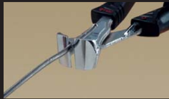
Pince coupante frontale End cutting pliers