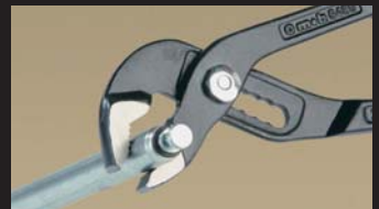
Pince multiprise Multigrip plier