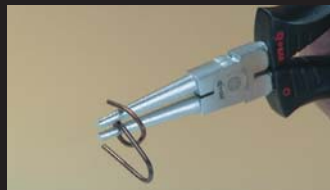
Pince à becs ronds Round nose pliers