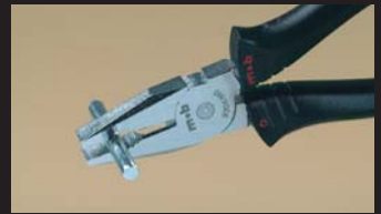
Pince universelle - zone de prise Tightening zone