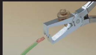
Pince à dénuder Wire stripping pliers