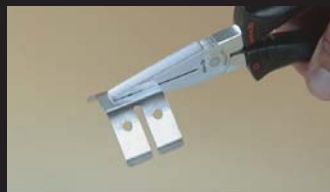
Pince à becs plats Flat long nose pliers