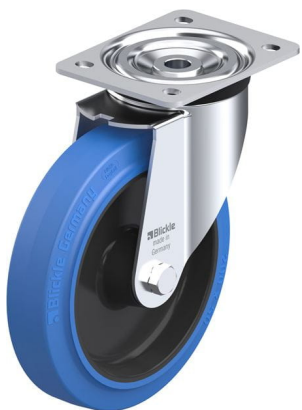
Roulette pivotante correspondante L-POEV 200R-SB