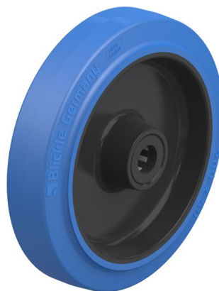
Roue utilisée POEV 200/20R-SB