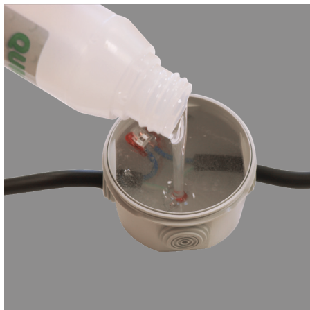
5. Verser le mélange dans le volume à étanchéifier. Patienter 12 minutes à 25°C pour une polymérisation complète