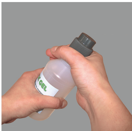
1. Dévisser le bouchon du flacon