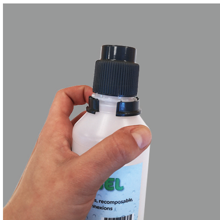
2. Retirer la languette de sécurité pour permettre le vissage complet du bouchon