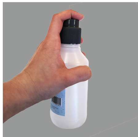
3. Visser le bouchon jusqu'à la butée et secouer pendant 15 secondes