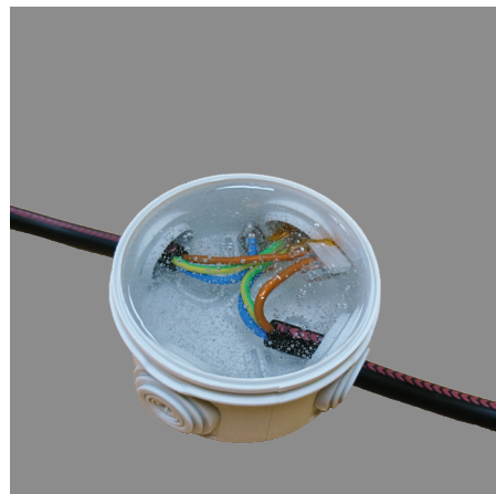
5. Les gels QUICK GEL sont recomposables et permettent une intervention ultérieure sur la connexion, sans altérer l'étanchéité