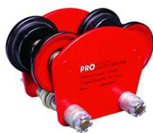
Chariot Porte Palans