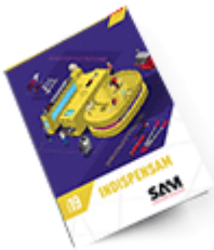
Les outils Indispensables SAM 2019

Découvrez tous nos produits dans nos catalogues en ligne