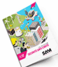
Sécurité anti-chute 2017