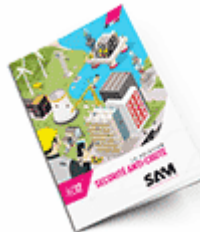
Sécurité anti-chute 2017 Consulter le catalogue