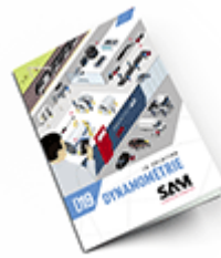
Dynamométrie 2019 Consulter le catalogue