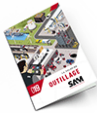
Outillage 2019 Consulter le catalogue