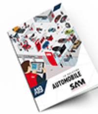
Automobile 2019 Consulter le catalogue