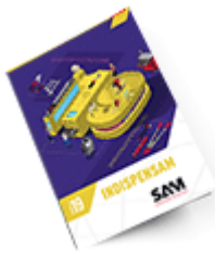
Les outils Indispensables SAM 2019