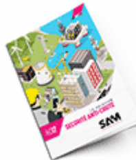
Sécurité anti-chute 2017