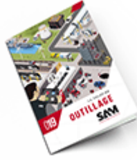
Outillage 2019 Consulter le catalogue