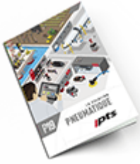
Pneumatique 2019 Consulter le catalogue