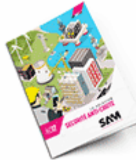
Sécurité anti-chute 2017 Consulter le catalogue