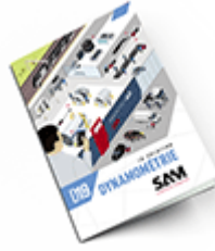
Dynamométrie 2019 Consulter le catalogue