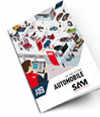
Automobile 2019 Consulter le catalogue