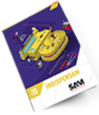
Les outils Indispensables SAM 2019 Consulter le catalogue

Découvrez tous nos produits dans nos catalogues en ligne